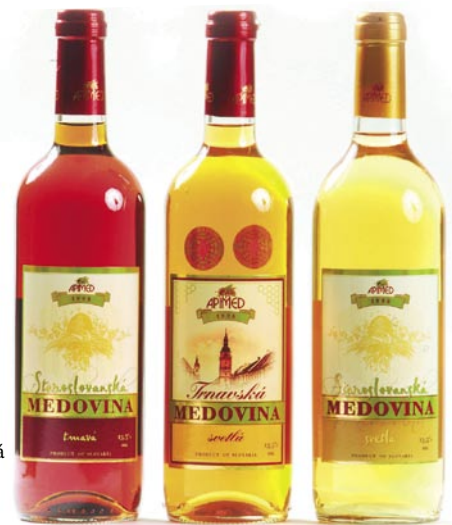
Staroslovanská medovina svetlá